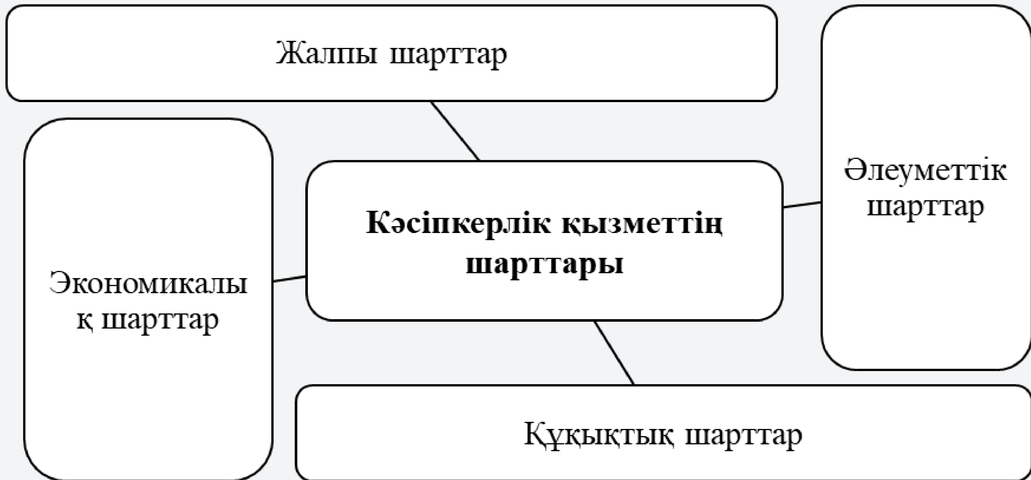
Сурет – Кәсіпкерлік қызметтің шарттары